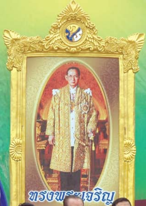
ทรงพระเจริญ

วันอาทิตย์ที่ 28 พฤศจิกายน ณ บริเวณพื้นที่คลองระบายน้ำ ต.คอนยาง อ.เมือง จ.