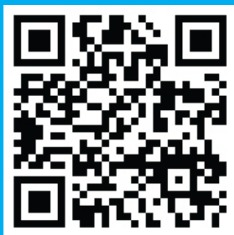
QR Code http://www.pbru.ac.th

สวัสดีครับท่านผู้อ่าน ท่านเคยเห็นรูปสี่เหลี่ยมจัตุรัส ขาวดำ ลายจุด ๆ และสงสัยหรือไม่ ว่ารูปอะไรมองไม่เห็นรู้เรื่องเลย บังเอิญผมได้ดูสื่อบริการไอทีในทีวีก็รู้ขึ้นมาบ้าง บวกกับหาข้อมูลเพิ่มเติม ตอนนี่รู้แล้วว่าเจ้ารูปแบบนี้ เขาเรียกกันว่า QRCode แล้วเจ้านี้มันคืออะไร? มาจากไหน? ทำหน้าที่อะไร? มีประโยชน์อะไร? และเราจะใช้มันในทางธุรกิจได้อย่างไร?