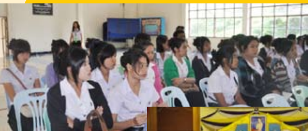
กิจกรรมวันแม่