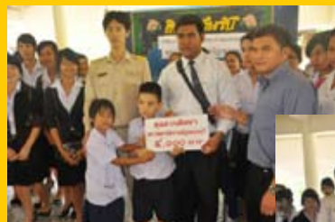
พิธีมอบทุนการศึกษาและสิ่งของ