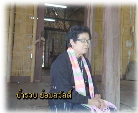
ป้ารวบ ย่อมสวัสดิ์