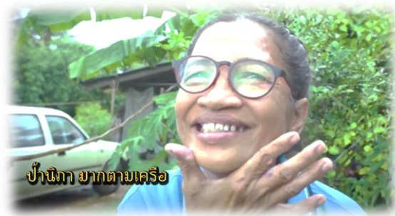
บ้านภา มากตามเครือ