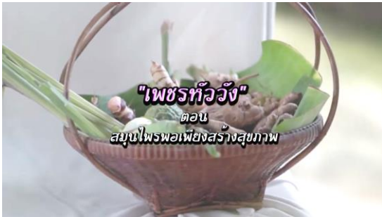
"เพชรทิวัง" ตอน สมุนไพรพองเพียงสร้างสุขภาพ