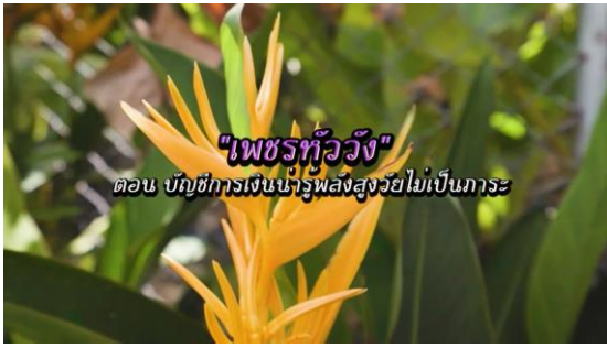
"เพชรทิวัง" ตอน บัญชีการเงินนำรูปส่งสูงวัยไม่เป็นการระ