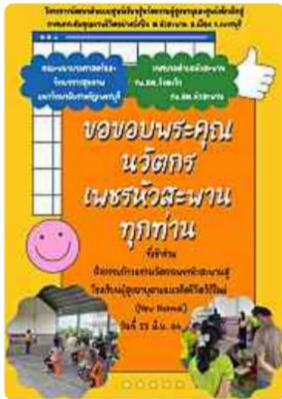
บันทึก | บันทึกเป็น... | แชร์ | Keep

เรียนท่านนวัตกรเพชรหัววังทุกท่าน ...ช่วงเย็นๆแบบนี้ ชาวทุกท่านมาเรียนรู้ในหลักสูตรผู้สูงอายุ ยุค new normal เรื่อง ทักษะชีวิตต้น... ...หากดูไม่ทัน ให้กดหยุดวิดีโอ แล้วอ่านได้เลยนะ... ...ทุกท่านสามารถตอบคำถาม แชร์ และเชิญชวนเพื่อนๆเข้ากลุ่มไลน์ได้เลย... 👉👉คลิกได้เลย👉👉 https://lin.ee/MJ1TUU4 แชร์ให้เพื่อนๆด้วยนะ... ท่านที่เข้ามาใหม่ อย่าลืมแจ้งชื่อ นามสกุล นะ... 🙏🙏 คณะพยาบาลศาสตร์และวิทยาการสุขภาพ มหาวิทยาลัยราชภัฏเพชรบุรี, เทศบาลตำบล หัวสะพาน, รพ.สต.วังตะโก, รพ.สต.หัวสะพาน และเครือข่าย