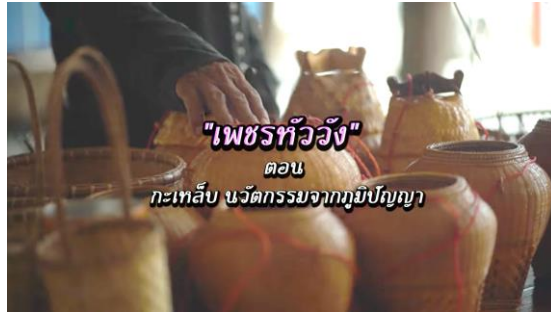
"เพชรทิวัง" ตอน กะเหล็บ นวัตกรรมจากภูมิปัญญา